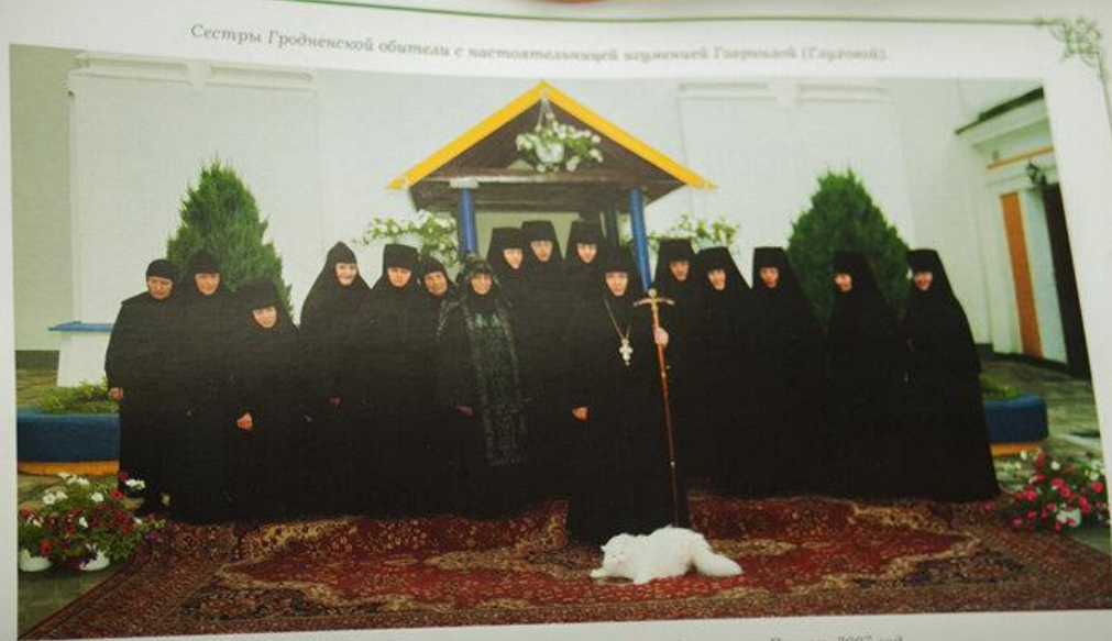
Сестры Гродненской обители с настоятельницей изумительной Гауринской (Гауринской)